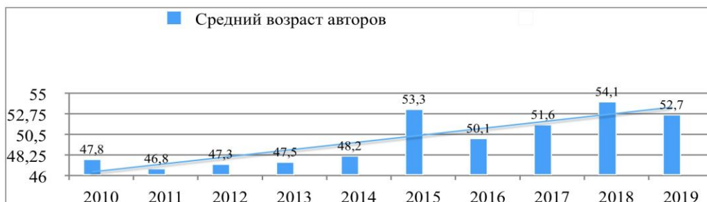
Рис. №4 Средний возраст авторов

В целом, научное сообщество и заинтересованная публика ежеквартально получает качественное, многогранное содержание, журнал международного уровня в привлекательном формате. Издание последовательно знакомит читателей с результатами исследований не только местного значения, но и с вопросами, соответствующими международным тенденциям исторической науки, а также классическими образцами научных исследований зарубежных авторов. В значительной степени расширяет коммуникативное пространство и ресурсность издания наличие сайта журнала, который позволяет осуществлять тематический поиск среди статей. Англоязычная версия сайта и перевод аннотации каждой статьи позволяет журналу стать частью международного экспертного пространства и продолжить важную и нужную работу по популяризации российской исторической науки.