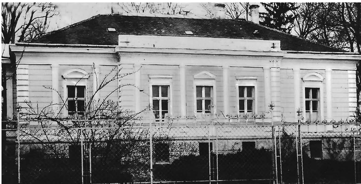
3. ábra. Nagyatádi szülőotthon. Eredeti képeslap Steiner Józsefné gyűjteményéből (elvesztett), reprint változat a Nagyatádi Városi Múzeum tulajdona