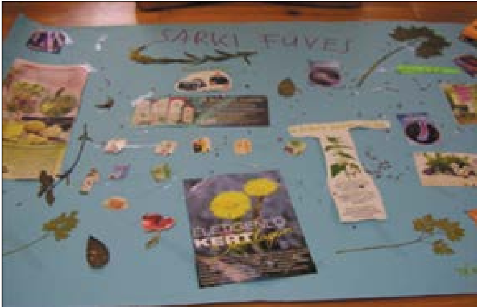
6. ábra. Koppánymonostor, 2014. A gyermekek gyógynövényboltja