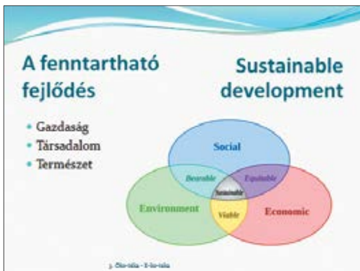
19. ábra. Azért, hogy a világunk elviselhető, igazságos, életképes, fenntartható lehessen

Be kell ruházni az oktatásba, a kultúrába, így a tudástárakba, a könyvtárakba is. A tudatosság a záloga egy szerethető, élhető és fenntartható világnak. A környezettudatosítás helyi szinten, helyi megoldásokkal, helyi példákkal a leghatékonyabb. A kihívásokra a holisztikus megközelítések adhatják a legjobb válaszokat, amelyek a társadalom minden rétegét képesek megszólítani.