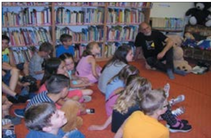
14. ábra. Környezetvédelmi Világnap, 2017. június 9., Komárom Jókai Mór Városi Könyvtár gyermekkönyvtára

náraik részvételével közösen meglekintették a Vad Magyarország - A vizek birodalma című filmet (amely egyébként Könyvtármozis film is), és játékos formában feldolgozták az ott látottakat. A film a legfontosabb hazai tájainkat mutatta be az állat- és növényvilágon keresztül az évszakok változásában. Nyelvi játékokon, fejtörőken keresztül az élővilággal kapcsolatban hívtuk fel a figyelmet hazánk természeti értékeire és a környezetünk megóvására.