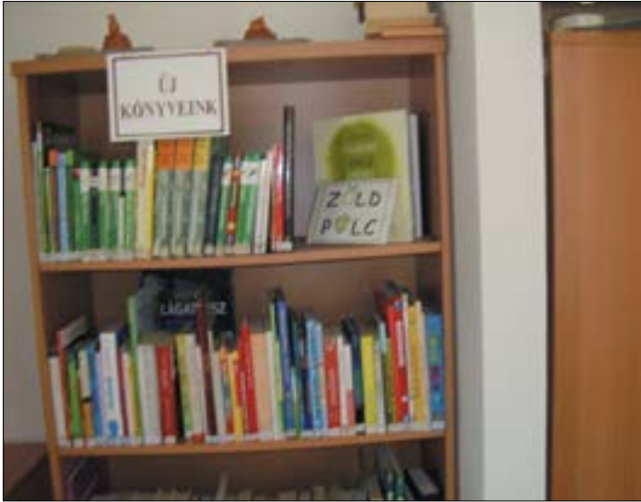
9. ábra. Zöldpolc Naszályon