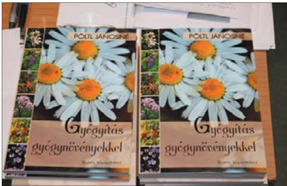
5. ábra. Egy könyvbemutató az Öko-esték sorozatunkban