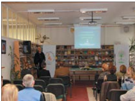
16. ábra. 2016. október 3., 45. Könyvtári Hét, Tatabánya JAMK. A Zöld Könyvtár prezentáció

2017 novemberében pedig meghívást kaptunk Nyíregyházára a Szabolcs–Szatmár megyei Könyvtáros Egyesület konferenciájára zöld témáink bemutatására.