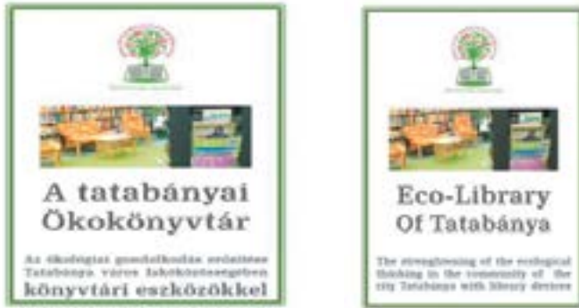
1. ábra. A tatabányai Ökokönyvtár

rességgel megjelenő öko-hírlevelek, az öko-cikktár válogatott bibliográfia, az ökofüzet, fotógalériák, cikkek a könyvtár ökotevékenységeiről és könyvbemutatóiról, írások, rendezvények, ajánlók és az MTI Környezetvédelmi Hírlevele.