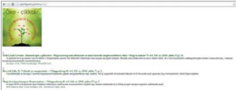
4. ábra. Az öko-cikktár és elérhetősége: http://sajtofigyeles.jamk.hu/oko