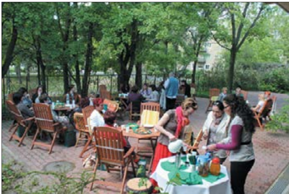
8. ábra. Határon túli kollégák látogatása, 2014. május 8. Életkép a zöld teraszon