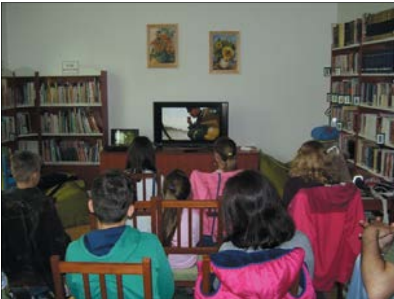
18. ábra. KönyvtárMozi ökoilmekkel, most éppen Dunaalmáson