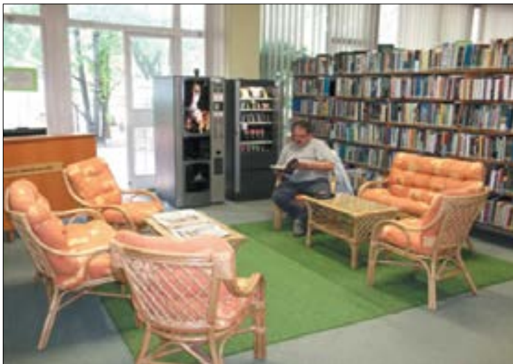
2. ábra. Ökosarok – öko olvasótér

Ökosarokként külön kis olvasótér lett kialakítva a könyvtáron belül. A tágabban értelmezett ökológia témaköreiből a jelenlegi kínálat mintegy 7000 kötet könyv és 30 folyóirat. Ebből kb. 1500 kötet a szabadpolcon is megtalálható. Könyvválasztékunk nemcsak a kimondottan természettudományos munkákat tartalmazza, hanem a más tudományterületek ökológiát érintő, kereszteső alkotásait is.