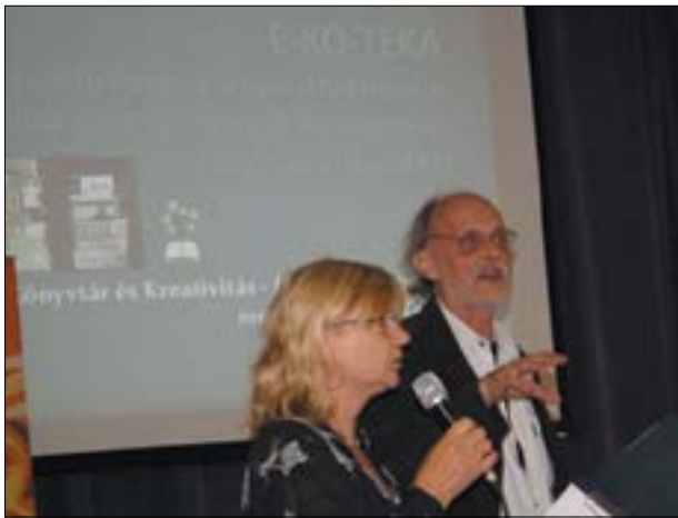
13. ábra. 2015. június 16–17., Zsolna. Rajecfűrdő ökoprezentáció

2015. április 13-án az érsekújvári Anton Bernolák családi-városi könyvtár meghívására és képviselőjében előbb Érsekújváron egy baráti találkozó keretében, majd nyár elején, Zsolnán és Rajecfűrdőn (június 16–17.) kétnapos nemzetközi könyvtáros konferencián vehettünk részt, ahol bemutattuk könyvtárunk ökotevékenységét. 2017-ben a Nyitrai Karol Kmetko Kerületi Könyvtárban, V4-es körben, lengyel, szlovák, magyar részvétellel mutatkoztunk be egy lehetséges közös projekt terveinek keretében.