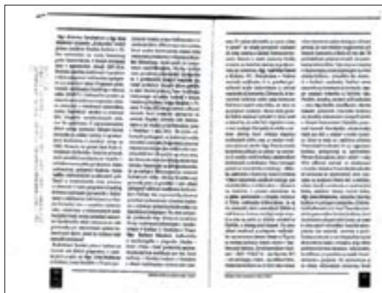
17. ábra. A szlovák könyvtáros sajtó a zsolnai konferenciáról szóló összefoglalójában ismerteti előadásunkat: Komunitná kniznica sa konala v Ziline. = Bulletin SAK, rocnik 23, cislo 3/2015. 41–47. p.