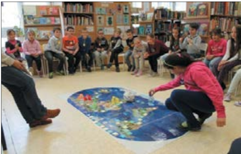
12. ábra. Mentsük meg Glóbit! ökotársasjáték

A gyermekkönyvtár is nagy hangsúlyt fektet a környezetvédelmi, ökológiai nevelés széles körben való terjesztésére, mind rendezvényeit, mind működését tekintve. Az elmúlt hét év eseményei közül a legfontosabbak: az óvodás, kisiskolás korosztály, és a sajátos nevelési igényű fiatalok számára tartott játékos interaktív foglalkozások, témnapok, táborok, pályázatok és az ökohét megszervezése. Évente a több mint 200 foglalkozásuk legtöbbször központi téma a környezettudatosság, a környezetvédelem.