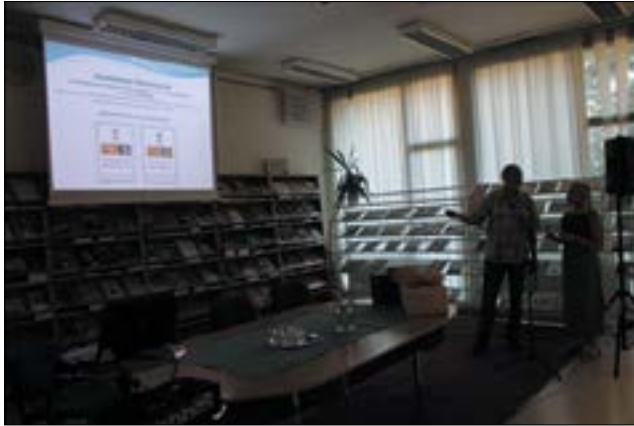
15. ábra. 2016. szeptember 14., Tatabánya. Szlovák–magyar szakmai találkozó

2016. október 3-án, a 45. Könyvtári Hét szakmai nap keretében ismertettük megyénk könyvtárosainak A Zöld Könyvtár című munkáinkat.