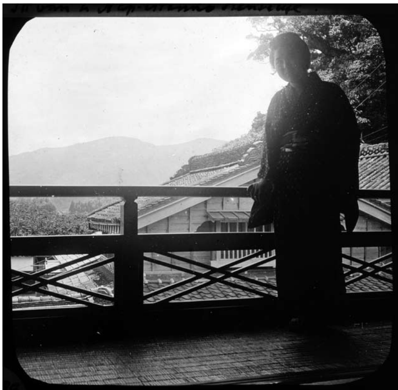
5. kép F2004.540

Bozóky Dezső: „Szobám erkélye a Yamada-Hotelben. Itt van a Nap-istennő szentélye” 1908