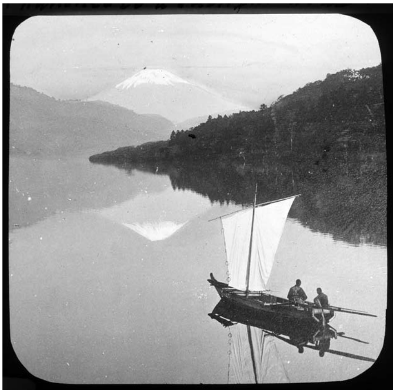
6. kép F2004.556