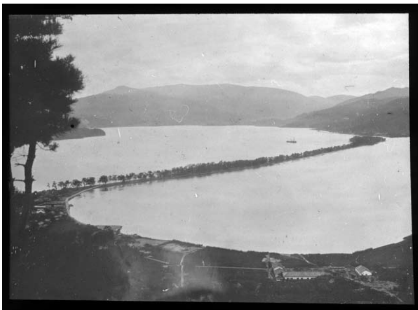
7. kép F2004.622

Bozóky Dezső: „Amano hasidate”. A Két év Keletáziában 495. oldalán publikált kép párdarabja. 1907–1908