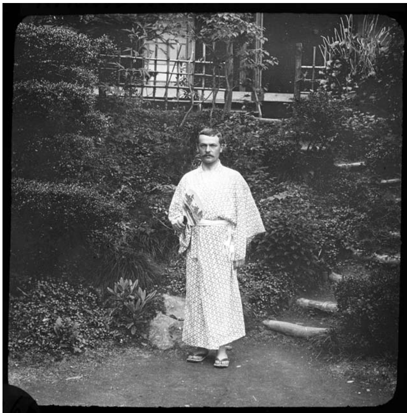
1. kép F2004.598 Bozóky Dezső: „Nikkói szállodámban” 1907 Kézzel színezett diapozitív Hopp Ferenc Ázsiai Művészeti Múzeum Adattára