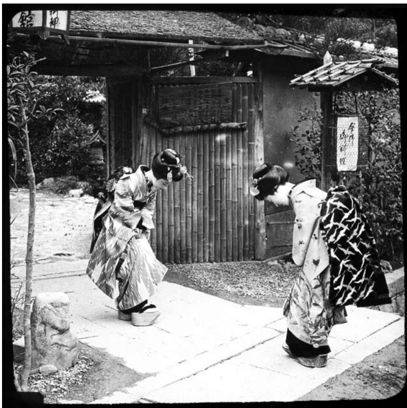
4. kép F2004.445