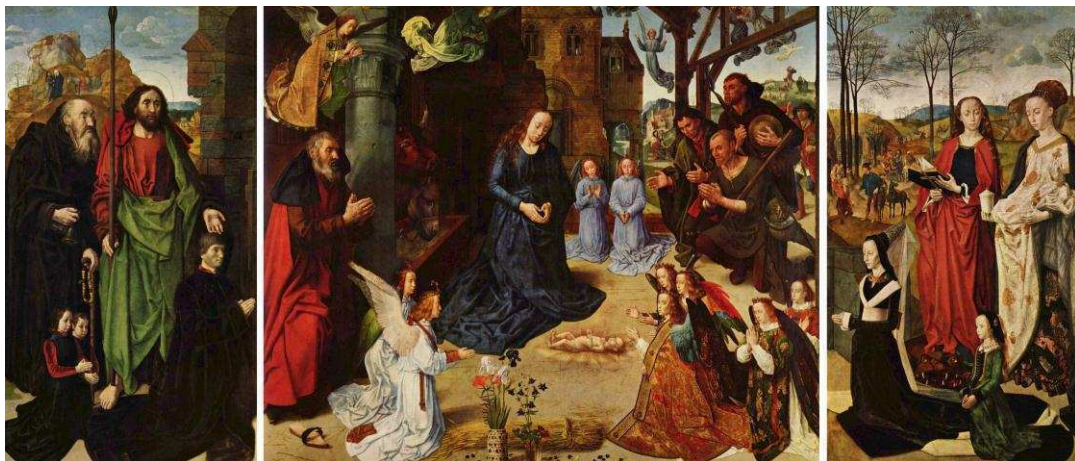
1. ábra: Hugo van der Goes: Pontinari-oltár 1

A középkori és reneszánsz idők határterületét interdiszciplináris aspektusból is (különösen kiemelve a neveléstudományi, művészettörténeti és művészetelméleti megközelítéseket) meg lehet vizsgálni. Feltételezésem szerint a média a képzőművészeti alkotások formájában igenis jelen volt már a középkori, de különösen a részletgazdag képeiről ismert reneszánsz képzőművészetben. A képzőművészeti alkotások pedig a történelem reprezentációi, segíthetnek feltárni a történelem darabkáit és összeilleszteni a mozaikokat. Segítségünkre lehetnek így abban is, hogy ezt a problémakört feldolgozzuk. Véleményem szerint a festmény mint a középkori média eszköze jelentős hatással bírt az emberek életére, hisz „élő televízióként” mutatta be egy-egy probléma, táj, esemény reflexióját; a középkori-reneszánsz ember pedig értette a szimbólumokkal átszőtt műalkotásokat (Endrődy-Nagy, 2011a).