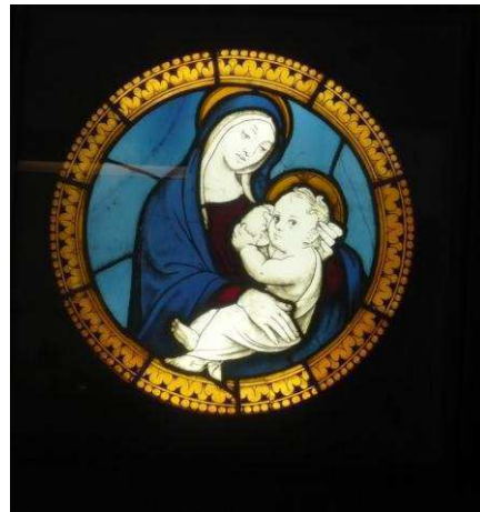
3. ábra: Jacques de Voragine: Születés az utcán, A Gyermekek Jézus 3 , 4. ábra: Ismeretlen alkotó Madonna a gyermekkel 4

A 3. kép a szülés utáni pillanatokat és időszakot idézi fel: a gyermek bemutatása, tisztítása, mosdatása és szoptatása. A szoptatás az ikonográfiában az oltalmazás és a bűnösökért való közbenjárás szimbóluma is egyúttal. (Maria lactans képtípus – Körber–Marosi et al., 1994, 226.) Ugyanezt az ábrázolástípust láthatjuk a 4. képen is.